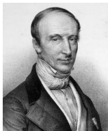
Augustin Louis Cauchy (1789-1857)