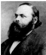
Hermann Amandus Schwarz(1843-1921)